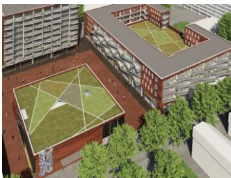
Meetcertificaat winkels en cultuurhuis te Rotterdam

Voor ons telt het resultaat: huisvesting die werkt voor ù.