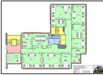
Indeling kantoor Vlietweg te Leidschendam