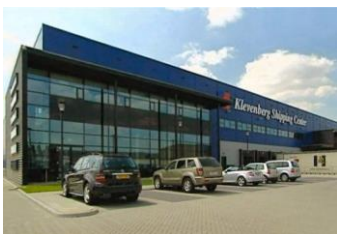
Projectmanagement bedrijfsgebouw Klevenberg Shipping

Voor de aanvang van uw project leggen wij in een plan van aanpak uw doelstellingen vast en geven onder andere aan hoe de communicatielijnen tijdens het proces zullen lopen. Hiermee ontstaat een duidelijk raamwerk waarbinnen elke deelnemer zijn eigen taken en verantwoordelijkheden heeft.